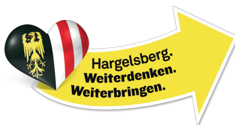
Eröffnung des Kinder- und Jugendferienprogramms 2022