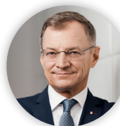
Thomas Stelzer Landeshauptmann

„Wir stehen zu unserer christlich-sozialen Verantwortung, indem wir jenen helfen, die unsere Hilfe brauchen.“