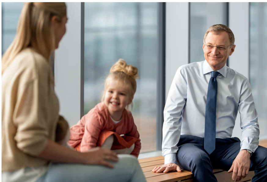
Familien werden mit den Entlastungspaketen besonders unterstützt.

Die steigenden Preise werden zu einer immer größeren Belastung für viele. Insbesondere Familien fällt es immer schwerer, die steigenden Lebenshaltungskosten zu bewältigen.