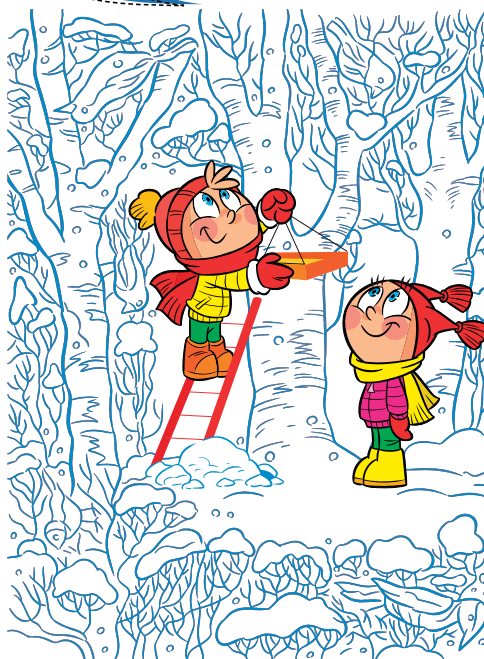
LÖSUNGEN: Wie gut kennst du Oberösterreich? 1: Christkindl, 2: Skifahren, 3: Eurotherme Bad Schallerbach (Aquatopia) Wie viele Vögel findest du? 5