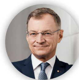
Thomas Stelzer Landeshauptmann

Helfen und schützen: Das ist unser gemeinsamer Auftrag in Oberösterreich. Sicherheit gibt den Menschen Zuversicht, Mut und Kraft.