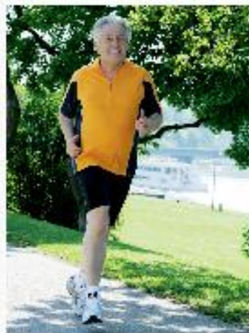
Auch regelmäßige Bewegung, wie beispielsweise Laufen, gehört zu einem gesunden Lebensstil.

Bereichen führend“, so Pühringer. Eine ganz wesentliche Rolle nehmen hierbei die Gesunden Gemeinden wahr: 424 der 444 oberösterreichischen Städte und Gemeinden dürfen sich „Gesunde Gemeinde“ nennen. Die Aktivitäten und Angebote sind vielfältig und individuell an die örtlichen Bedürfnisse angepasst. „Die Gesunde Gemeinde in Oberösterreich ist ein Vorzeigeprojekt für ganz Österreich“, sagt Pühringer.