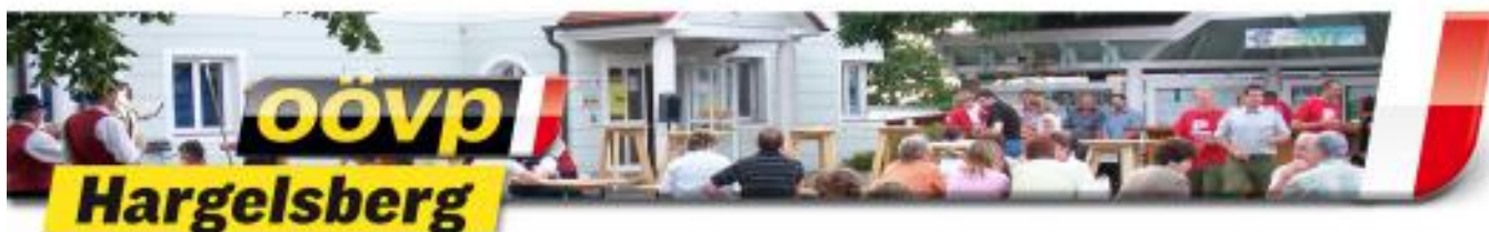
ÖAAB Obmann / Hargelsberg