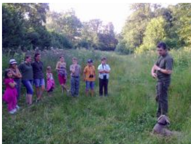
Mit dem Jäger unterwegs