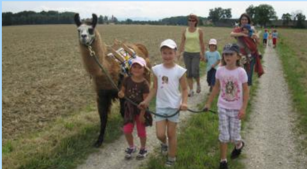
Wandern in Hargelsberg