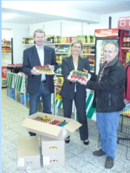
Ostereier vom Nahversorger

Die ÖVP wünscht allen ein frohes Osterfest