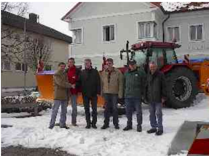
Foto: Vertreter der Fa. Hochrath und der Fa. Hydrac übergeben die neuen Geräte an Bürgermeister und Einsatzfahrer.

Viel positives Echo aus der Bevölkerung gab es für die Umstellung des Winterdienstes von Split- auf Salzstreuung im gesamten Gemeindegebiet. Ein Danke unseren verlässlichen Fahrern und Gemeindemitarbeitern, die wenn notwendig zu fast jeder Tages- und Nachtzeit im Einsatz waren!