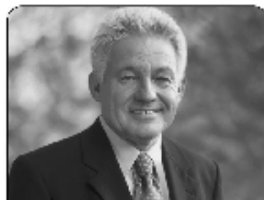
Pühringer: Arbeitsplätze sind das Wichtigste

nen wir verstärkt investieren. Zum Beispiel in Forschung, Entwicklung, Bildung, Infrastruktur oder Spitälern und Heimen. Und mit diesen Investitionen werden wir unseren Platz auch im Spitzenfeld Europas sichern“, so Pühringer.