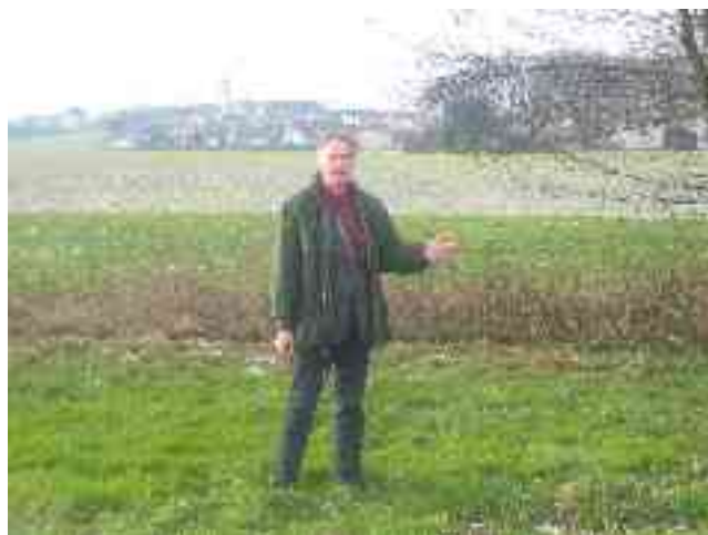
Ökofläche beim Stallbach